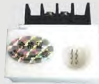
电机温度保护模块